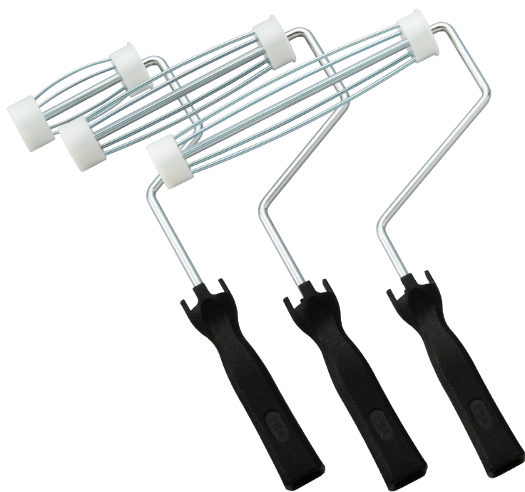
レギュラーハンドルS型 4インチ・7インチ・9インチ