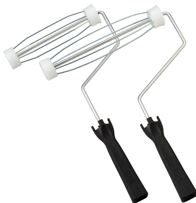
軽量レギュラーハンドル 7インチ・9インチ